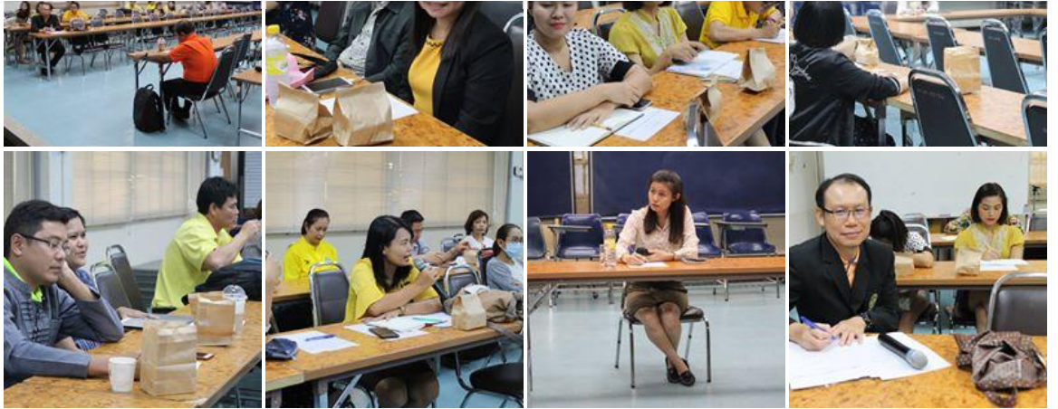
คุณ และคนอื่นๆ อีก 3 คน