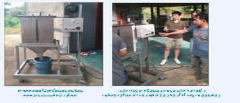
ภาพแสดงการทำงานของเครื่องอบลมร้อนลดความชื้นเมล็ดข้าวโพด และภาพแสดงการใช้งานจริง