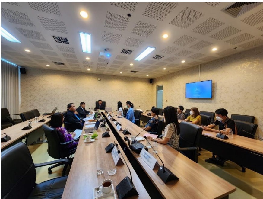
การสัมภาษณ์ผู้บริหาร อาจารย์ และบุคลากร