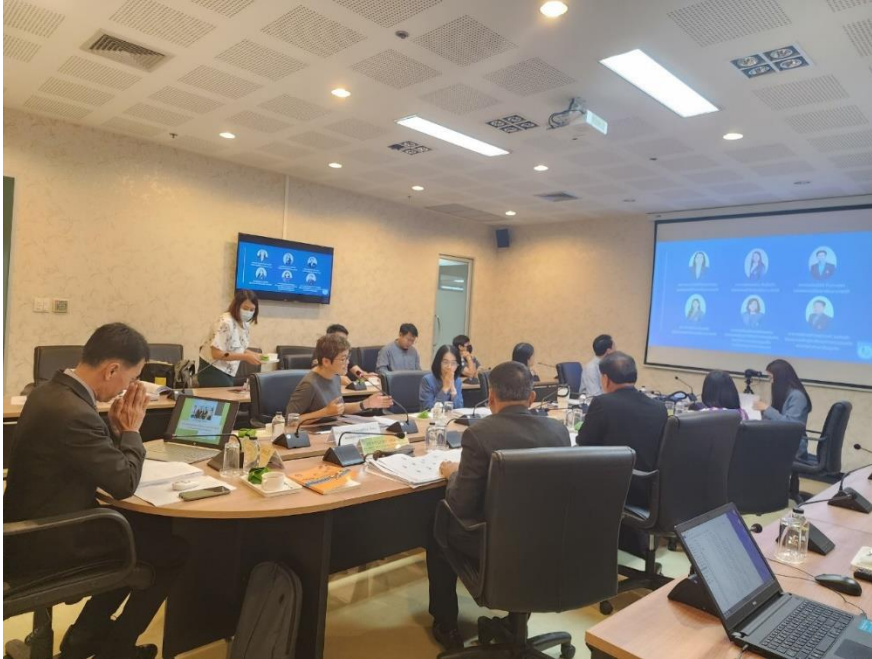
คณบดีกล่าวต้อนรับและนำเสนอผลการดำเนินงานแก่คณะกรรมการประเมินคุณภาพการศึกษาภายใน ระดับวิทยาลัย