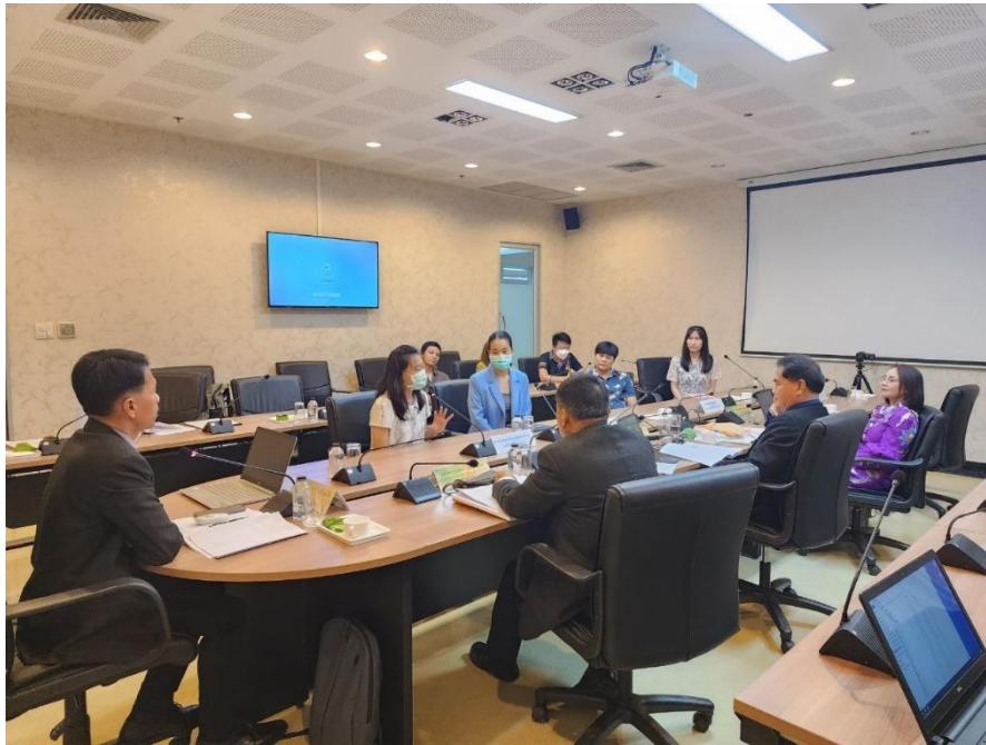
การสัมภาษณ์ผู้บริหาร อาจารย์ และบุคลากร