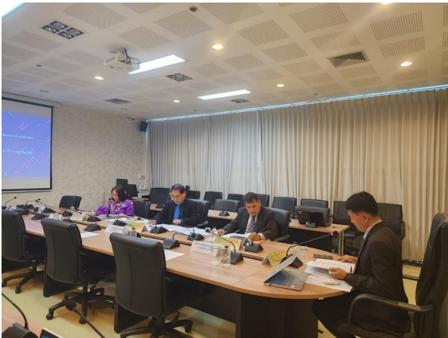
การสรุปผลการประเมินคุณภาพการศึกษาภายใน ระดับวิทยาลัย