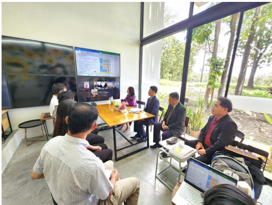
การสรุปผลการประเมินคุณภาพการศึกษาภายใน ระดับวิทยาลัย