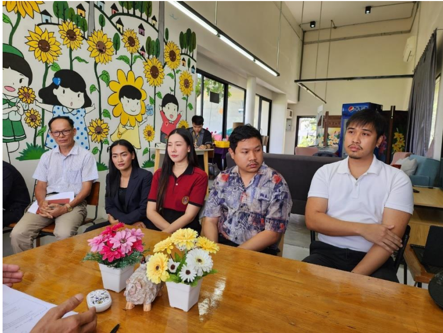
การสัมภาษณ์ผู้แทนศิษย์เก่าและศิษย์ปัจจุบัน