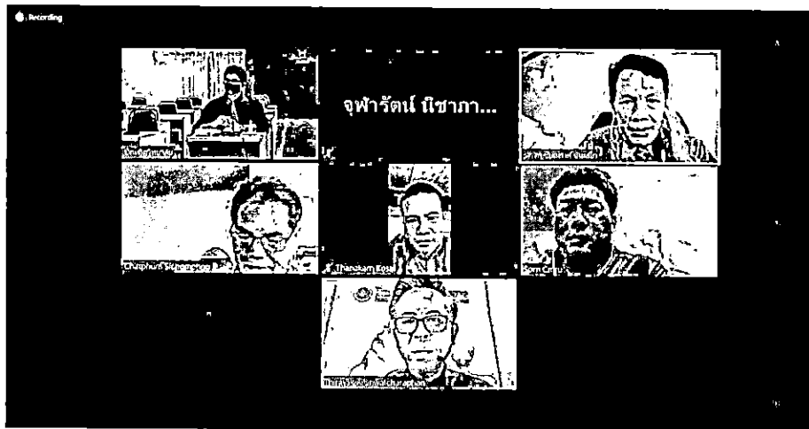
การสัมภาษณ์ผู้แทนศิษย์เก่าและศิษย์ปัจจุบัน