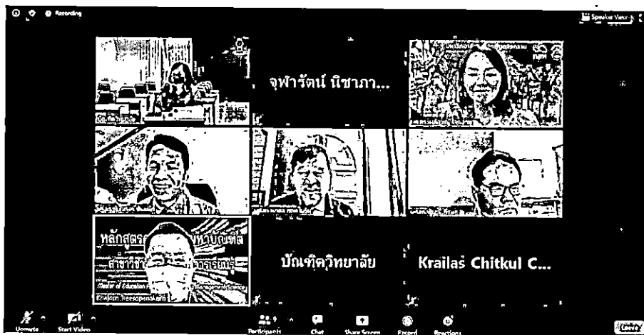
การสัมภาษณ์ผู้บริหารบัณฑิตวิทยาลัย