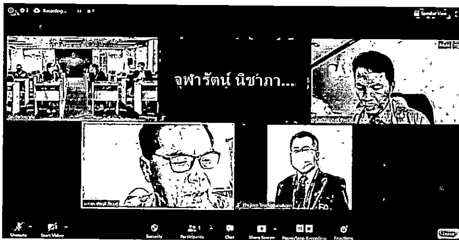
การแบ่งกลุ่มประเมินตามองค์ประกอบ (องค์ประกอบที่ 1, 4, 5)