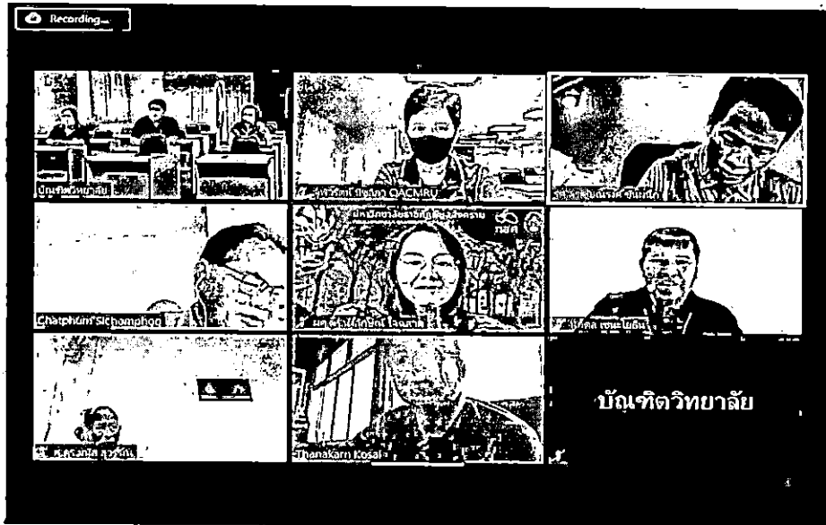
การสัมภาษณ์ผู้แทนผู้ใช้บัณฑิตและผู้แทนชุมชน