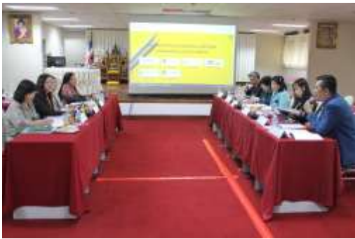
คณะกรรมการดำเนินการการสัมภาษณ์