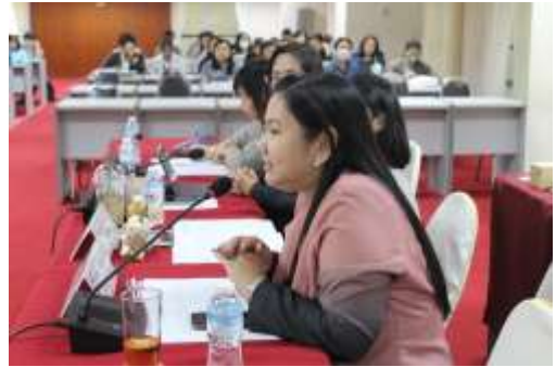
ประธานกรรมการประเมินชี้แจงวัตถุประสงค์การตรวจเยี่ยม