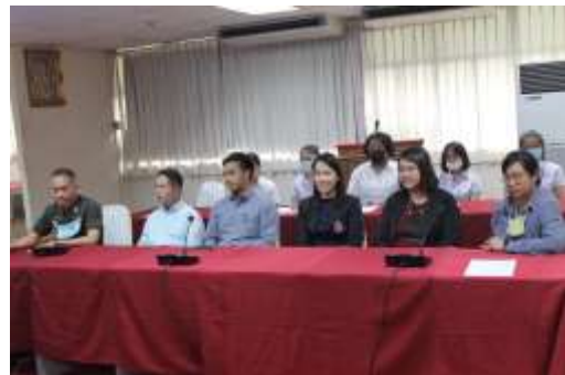
คณะกรรมการดำเนินการการสัมภาษณ์