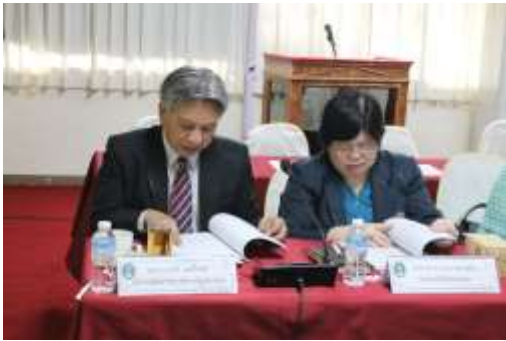
อธิการบดีกล่าวต้อนรับคณะกรรมการประเมิน