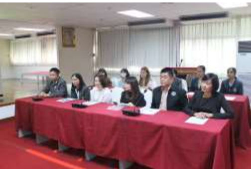
คณะกรรมการดำเนินการการสัมภาษณ์