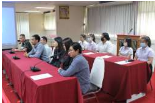
คณะกรรมการดำเนินการการสัมภาษณ์