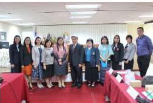
ผู้บริหารบัณฑิตภาพร่วมกับคณะกรรมการ