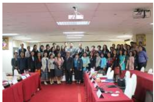
บัณฑิตภาพร่วมกับคณะกรรมการ