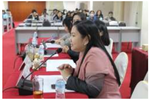
ประธานกรรมการประเมินชี้แจงวัตถุประสงค์การตรวจเยี่ยม