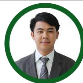
นายกวัด ฌ สิงห์ทร นักวิชาการศึกษา