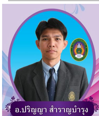
หัวหน้าภาควิชาพลศึกษาและ นันทนาการ