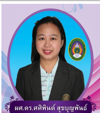
หัวหน้าภาควิชาการศึกษา