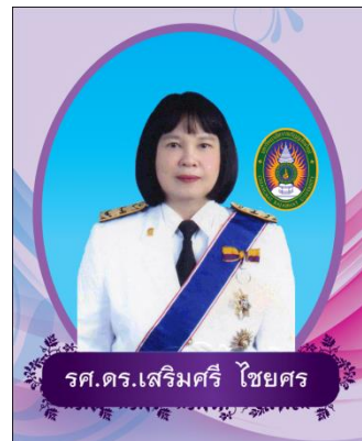
กรรมการผู้ทรงคุณวุฒิ