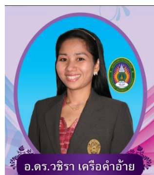
รองคณบดีฝ่ายวางแผน และพัฒนา