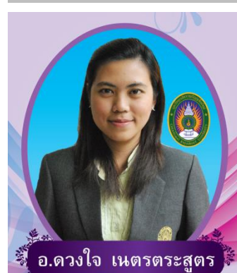
หัวหน้าภาควิชาการศึกษา