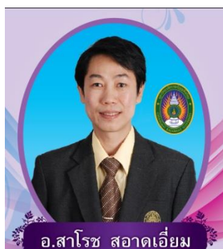
รองคณบดีฝ่ายวิชาการ