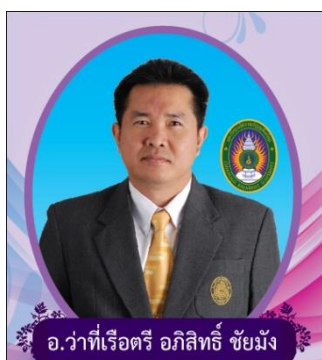
รองคณบดีฝ่ายบริหารและกิจการ นักศึกษา