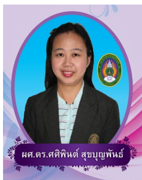
กรรมการจากผู้บริหาร