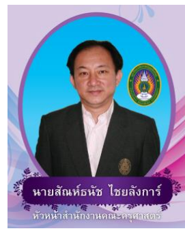
กรรมการจากคณาจารย์ประจำ