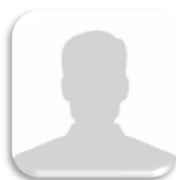
หัวหน้าสำนักงาน สถาบันวิจัยและพัฒนา กรรมการและเลขานุการ (อยู่ในระหว่างการสรรหา)