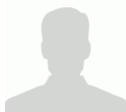
หัวหน้าสำนักงาน สถาบันวิจัยและพัฒนา กรรมการและเลขานุการ