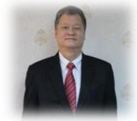
รศ.นพ.สิทธิพร บุญยนิษฐ์ ทรงคุณวุฒิ