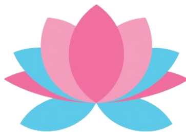
ภาพที่ 1 สัญลักษณ์ประจำสำนักส่งเสริมวิชาการและงานทะเบียน