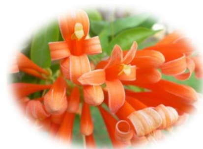
ดอกพวงแสด

สีแสด แทนค่า สีที่มีความสว่าง เจิดจ้าเปรียบเสมือนความเข้มแข็งของวิชาการ นำไปสู่ปัญญาในการประกอบกิจการงาน รวมถึงความมั่นคง มีทรัพย์สินเงินทอง ซึ่งสอดคล้องกับพาณิชย์และบัญชี