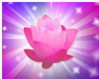
ภาพที่ 1.2 รูปดอกบัว

ดอกไม้ประจำสำนักส่งเสริมวิชาการและงานทะเบียน