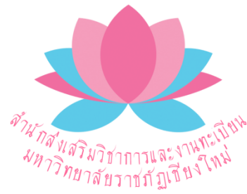
ภาพที่ 1.1 สัญลักษณ์ประจำสำนักส่งเสริมวิชาการและงานทะเบียน

ตราสัญลักษณ์ประจำสำนักส่งเสริมวิชาการและงานทะเบียน